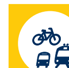
Info zu Bahn, Bus und Rad